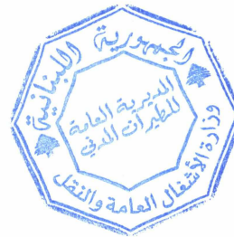
المهندس فادي الحسن